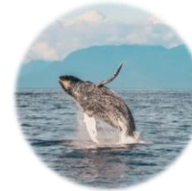
Prince of Whales (Vancouver, Victoria & Telegraph Cove, BC)