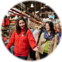
Vancouver Foodie Tours (Vancouver, BC)