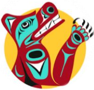
Homalco Wildlife & Cultural Tours (Campbell River, BC)