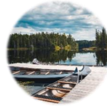
Okwari le Fjord (La Baie, QC)