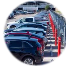
Groupe AVIS Budget