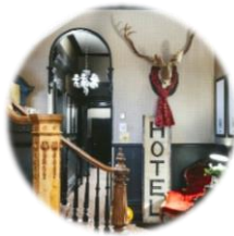
Hôtel Nomad (Québec, QC)

✓ Voici des exemples de bonnes pratiques mises en place par nos partenaires :