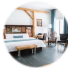
Le Baluchon Éco-Villégiature (Saint-Paulin, QC)