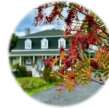
Auberge musicale Pour un instant (La Malbaie, QC)