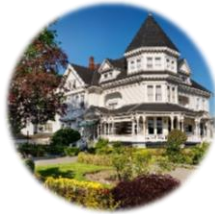
The Huntingdon Manor (Victoria, BC)