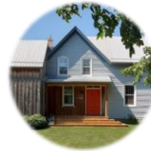
The Wilfrid Boutique Farmhouse (Milford, ON)